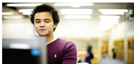
IELTS online registration